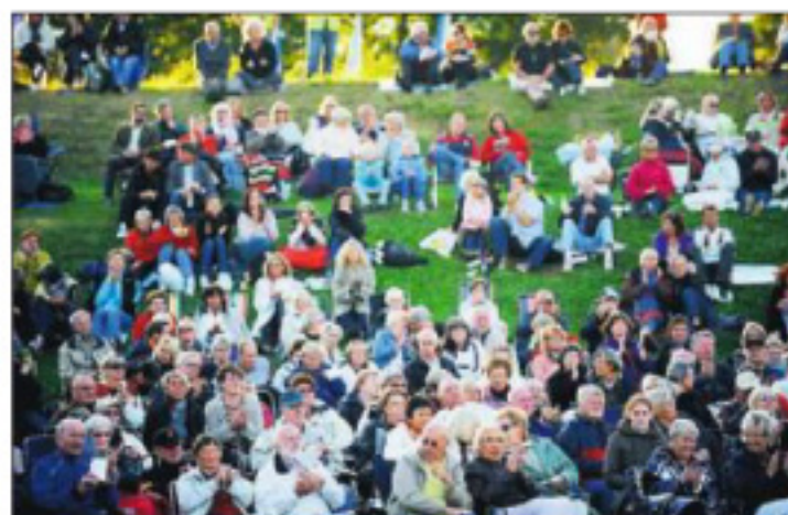
HERLIG OPPMØTE Det var knyttet stor spenning til været, men med sol og blå himmel fant et publikum på cirka 1000 veien til Isegran.